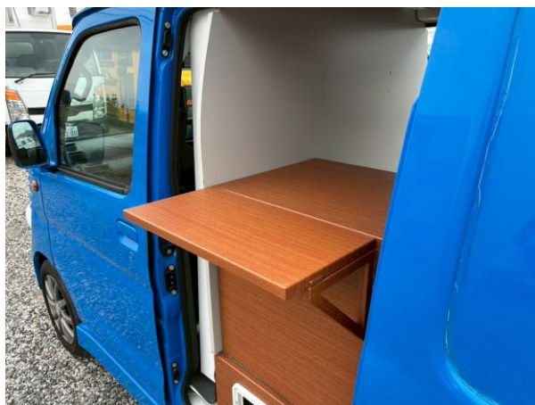
販売面カウンター