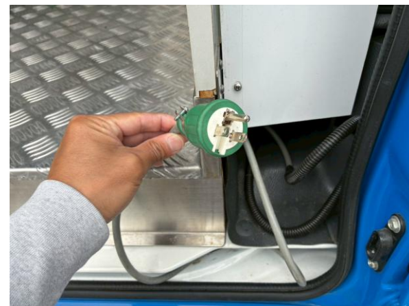
外部入力電源コード