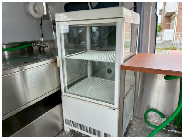
冷蔵ショーケース (AG-54XB-B)