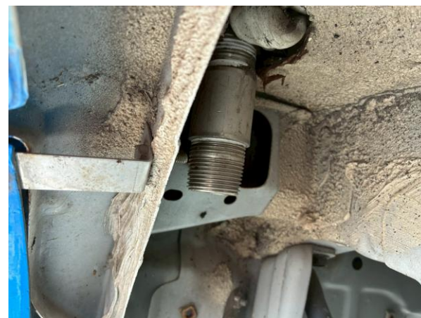
排水口 (リア右タイヤ)