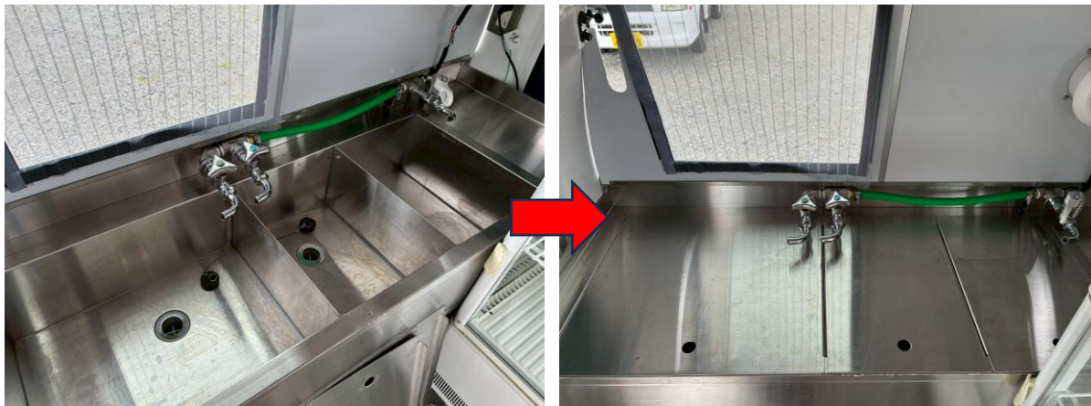
1槽シンク + 手洗いシンク (蓋付) 作業台