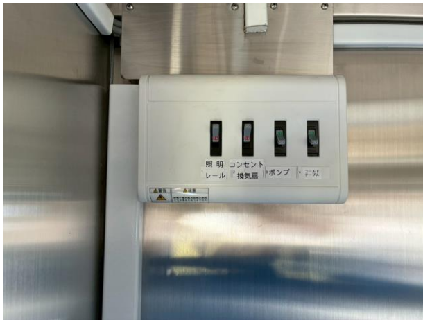
外部電源引き込みブレーカー