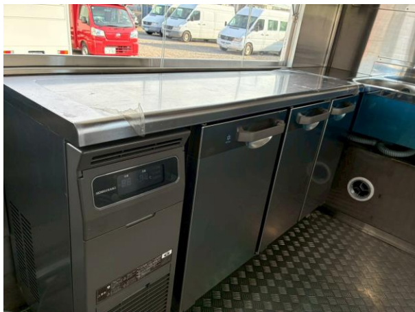
コールドテーブル (RFT-150MTCG-ML)