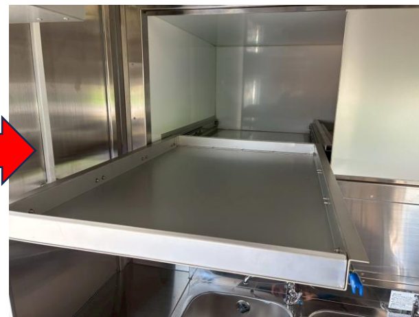
スライド式収納スペース