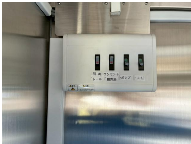
外部電源引き込みブレーカー