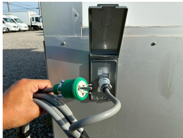
外部入力電源コード