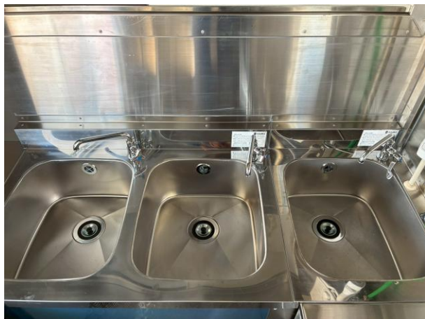
2槽シンク + 手洗いシンク