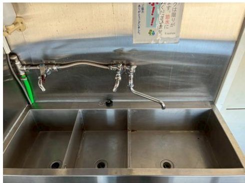
2槽シンク＋手洗いシンク