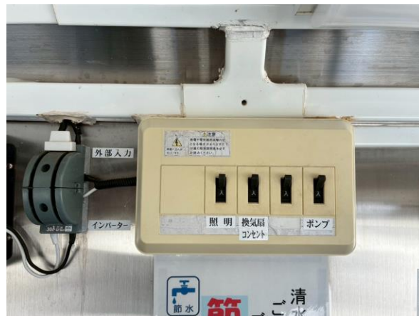
外部電源引き込みブレーカー