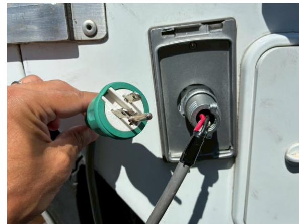
外部入力電源コード