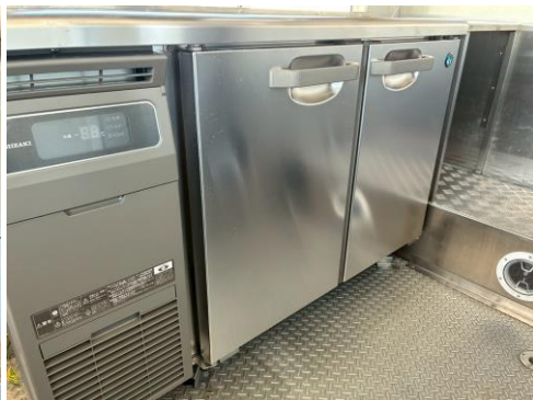
コールドテーブル (RT-120MTCG-ML)