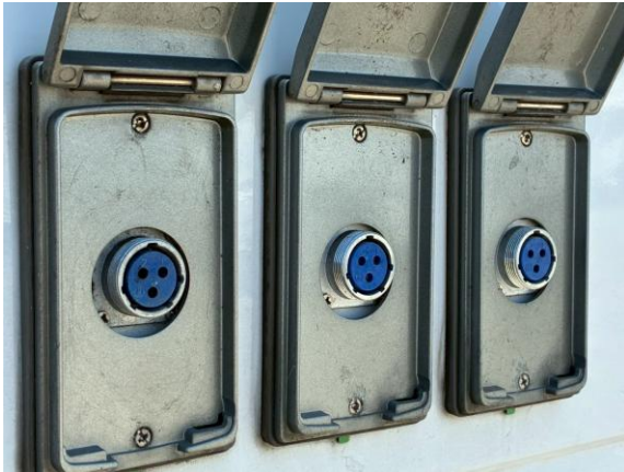
外部入力 IH専用① IH専用②