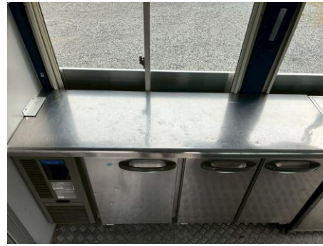
コールドテーブル (形名RFT-150MTCG-ML)