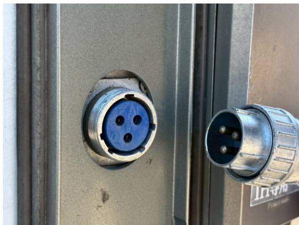
外部入力電源コード