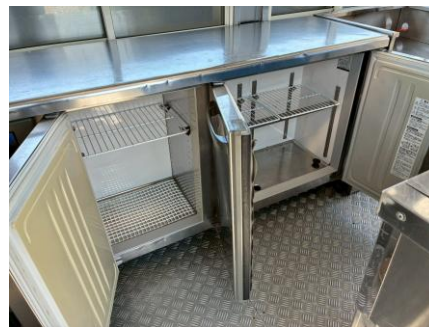
コールドテーブル (形名RFT-150MTCG-ML)