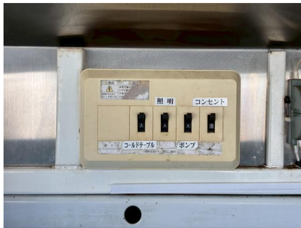
外部電気引き込みブレーカー