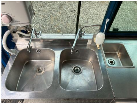
2槽シンク+手洗いシンク