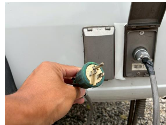
外部入力電源コード