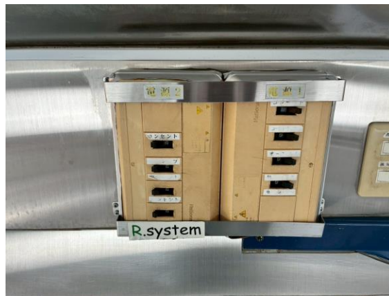
外部電気引き込みブレーカー