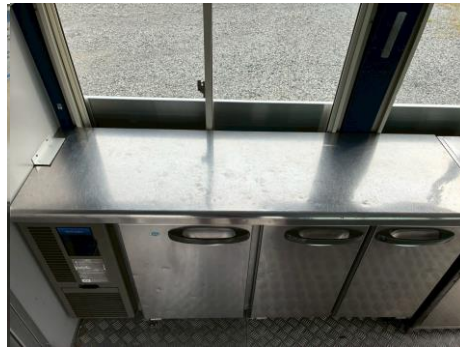
コールドテーブル (形名RFT150MTF-ML)