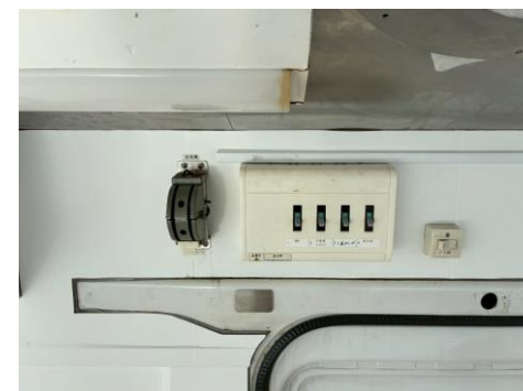
外部電気 引き込みブレーカー