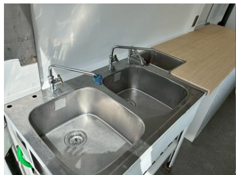
2槽シンク + 手洗いシンク