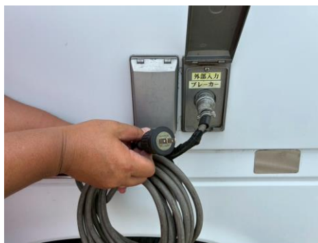
外部入力電源コード