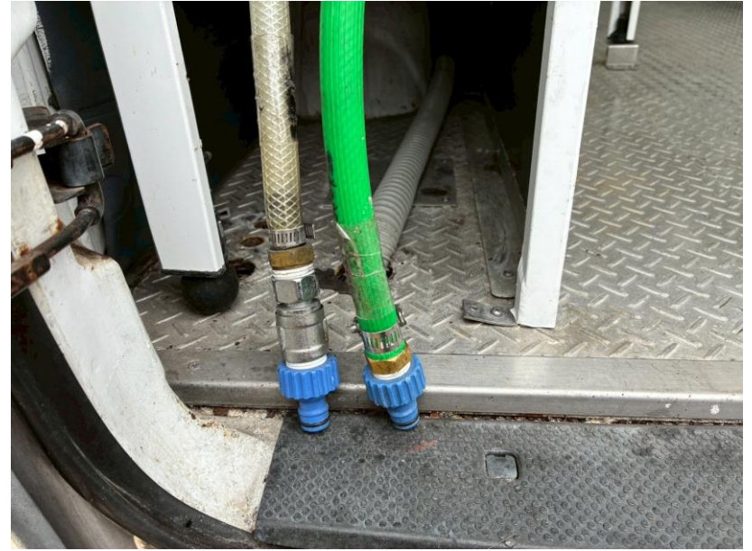
給水口 + 直結ホース