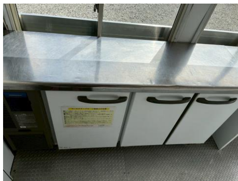
コールドテーブル (形名RFT-150MTF-ML)