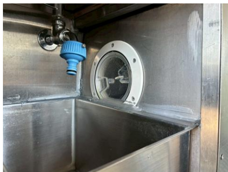
給水タンク 手洗いシンク