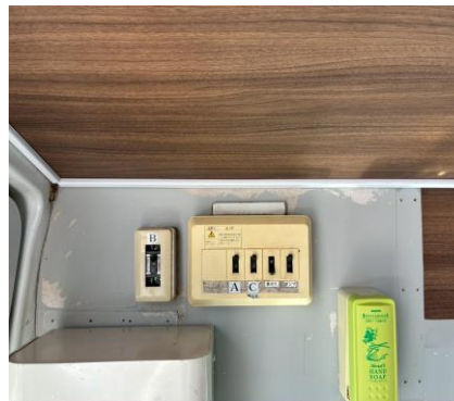
外部電源 引き込みブレーカー