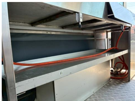
作業台下収納スペース