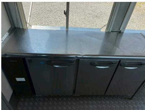
コールドテーブル (形名RFT-150PTE1)