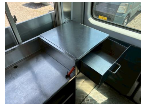
作業台 (引き出し付き)