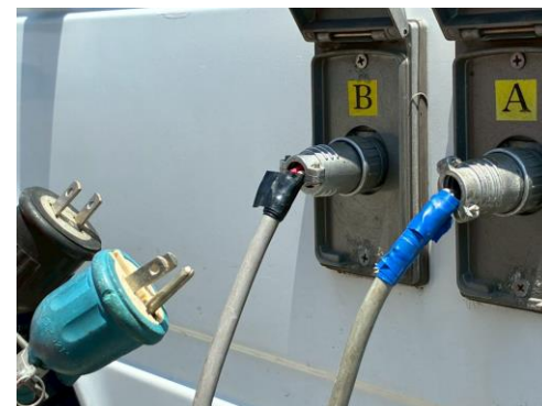
外部入力電源コード