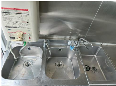
2槽シンク＋手洗いシンク