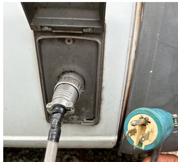
外部入力電源コード