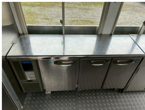
コールドテーブル (形名RFT-150MTF-ML)