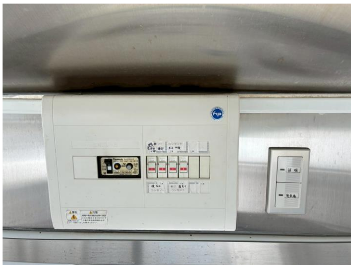
外部電源引き込みブレーカー