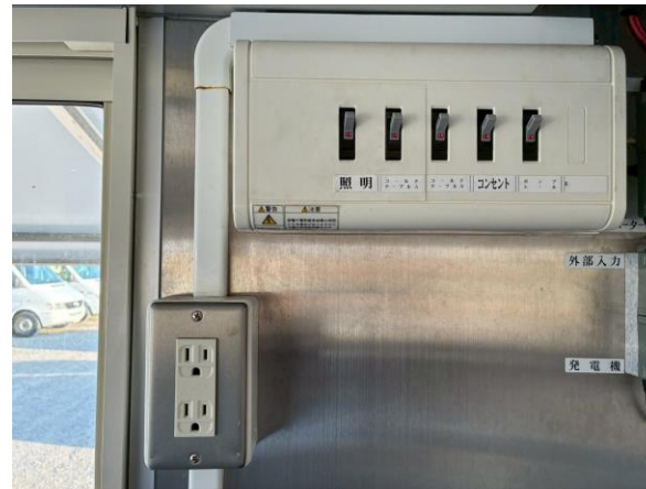
外部電源引き込みブレーカー