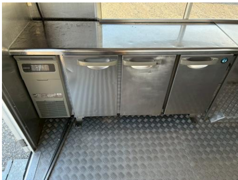
コールドテーブル冷蔵 (RT-150MTCG)