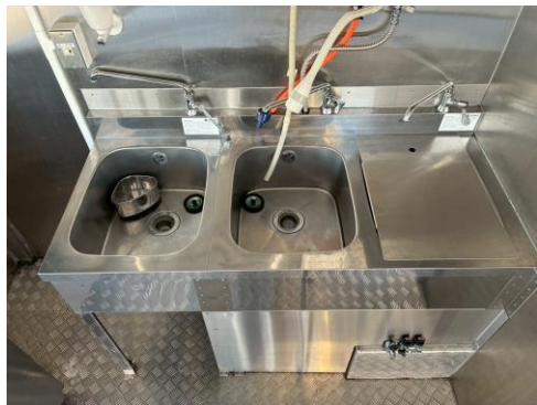
2槽シンク＋手洗いシンク