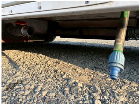
排水コック 直結ホース