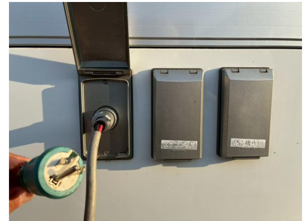
外部入力電源コード