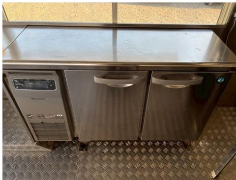
コールドテーブル冷凍 (FT-120MTCG)