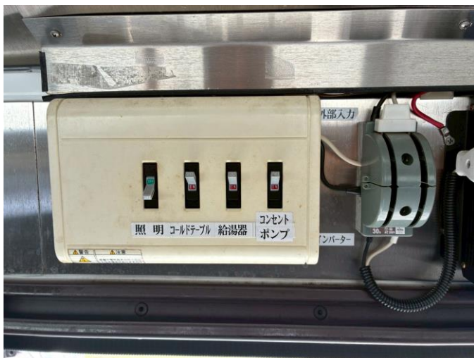
外部電気引き込みブレーカー