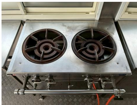
既存 2 口コンロ