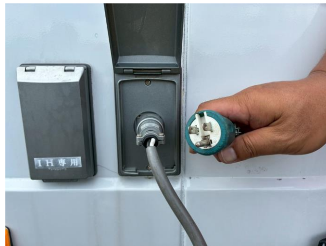
外部入力電源コード