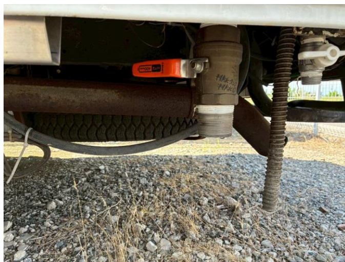
排水口 + 直結ホース