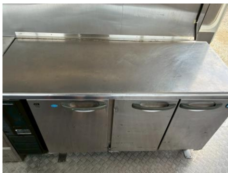
コールドテーブル (型式RFT-150PNE1)