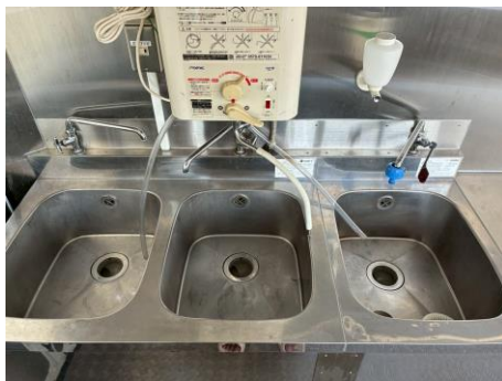
2 槽シンク 手洗いシンク