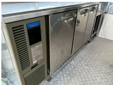
コールドテーブル (形名) RFT-150MTF-ML