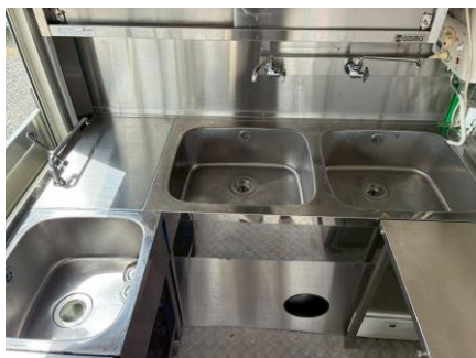
2槽シンク 手洗いシンク