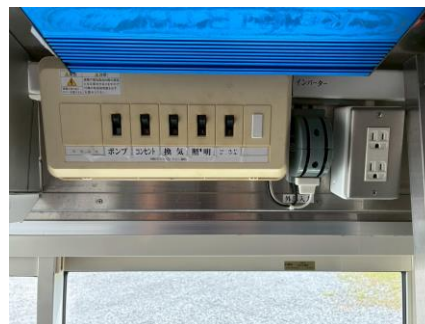
外部電気 引き込みブレーカー