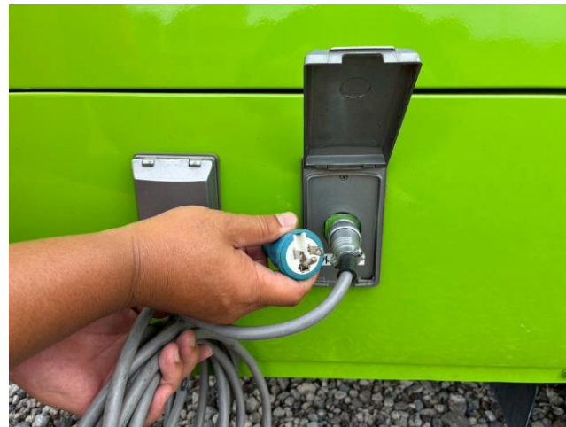
外部入力電源コード