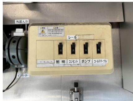
外部電気引き込みブレーカー