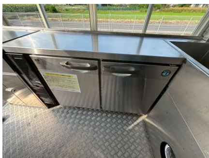
コールドテーブル (形名) RT-120PTE1