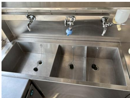
2槽シンク＋手洗いシンク