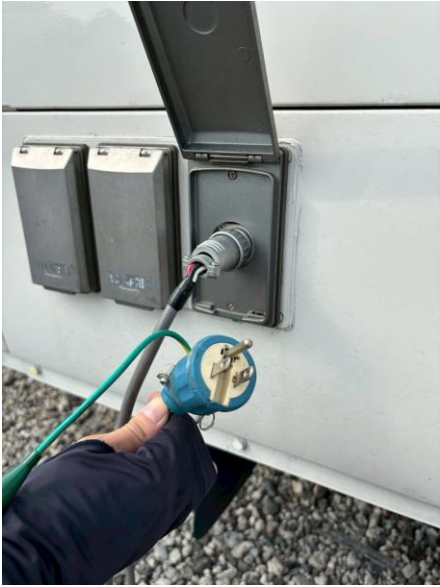
外部入力電源コード