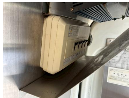
外部電気 引き込みブレーカー