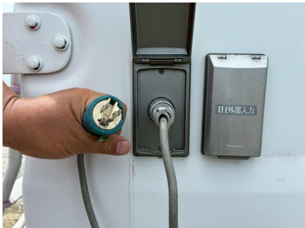
外部入力電源コード