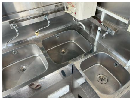
2 槽シンク 手洗いシンク