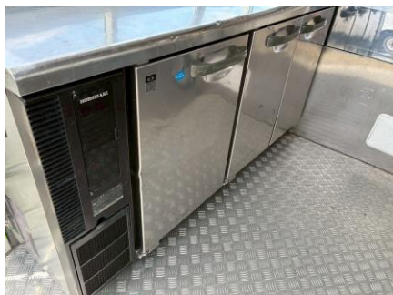
コールドテーブル (形名) RFT-150PTE1