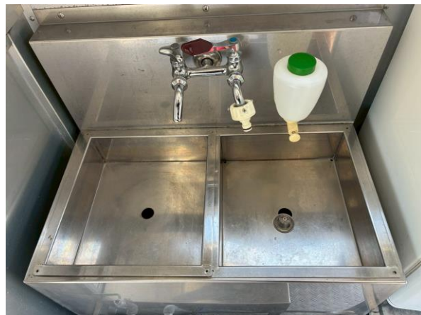
1 槽シンク + 手洗いシンク