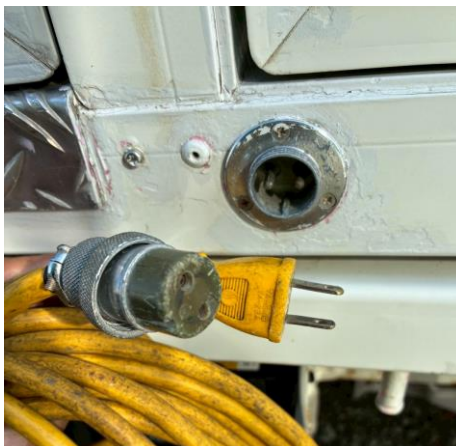
外部入力電源コード