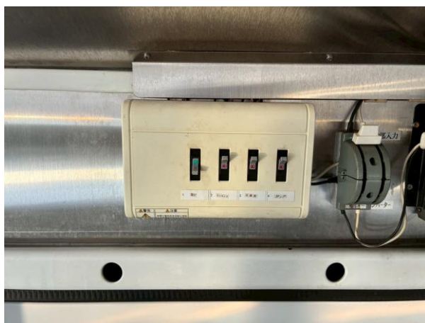
外部電気引き込みブレーカー