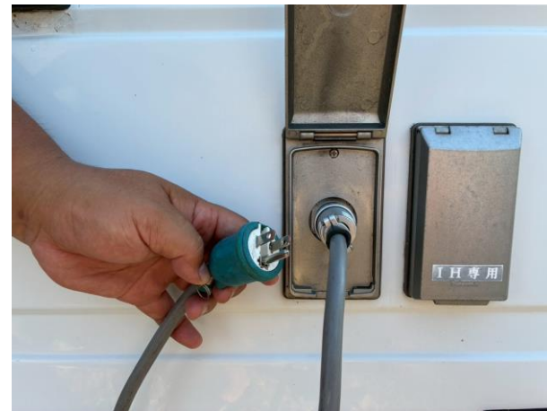
外部入力電源コード