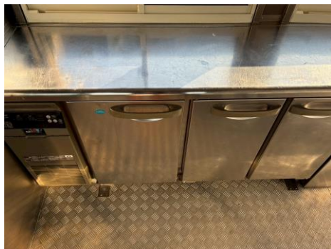
コールドテーブル (型式RFT-150MTCG-ML)