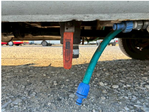
給水口 + 直結ホース + 排水コック