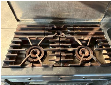
既存 3 口コンロ