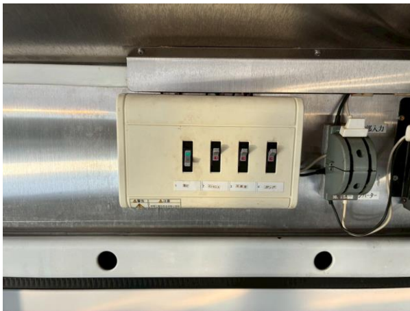
外部電気引き込みブレーカー