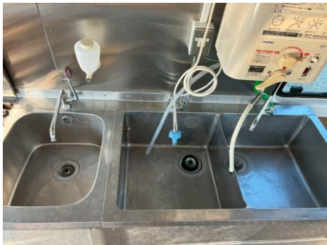
2 槽シンク 手洗いシンク