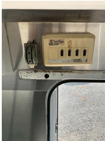
外部電気引き 込みブレーカー