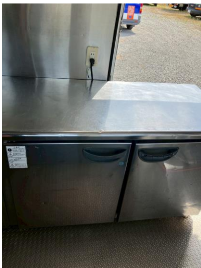
コールドテーブル (メーカー フクシマ)