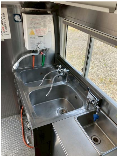
2槽シンク＋手洗いシンク